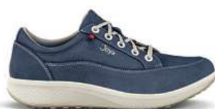
Lucy Blue | Joya 550-46-0001