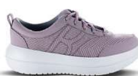
Bauma Pink | kybun 550-56-0005