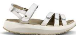
Merida White | Joya 552-10-310