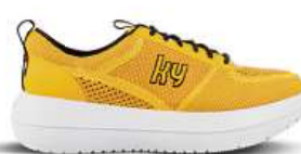
Meilen Gold | kybun 553-60-0001