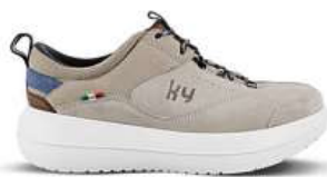
Karl Beige | kybun 553-40-7010