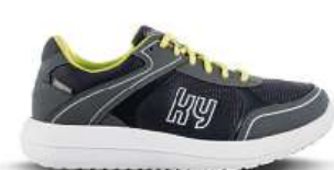
Maggingen Grey | kybun 553-23-0006