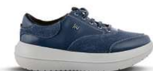
Aarau Blue | kybun 550-80-3021